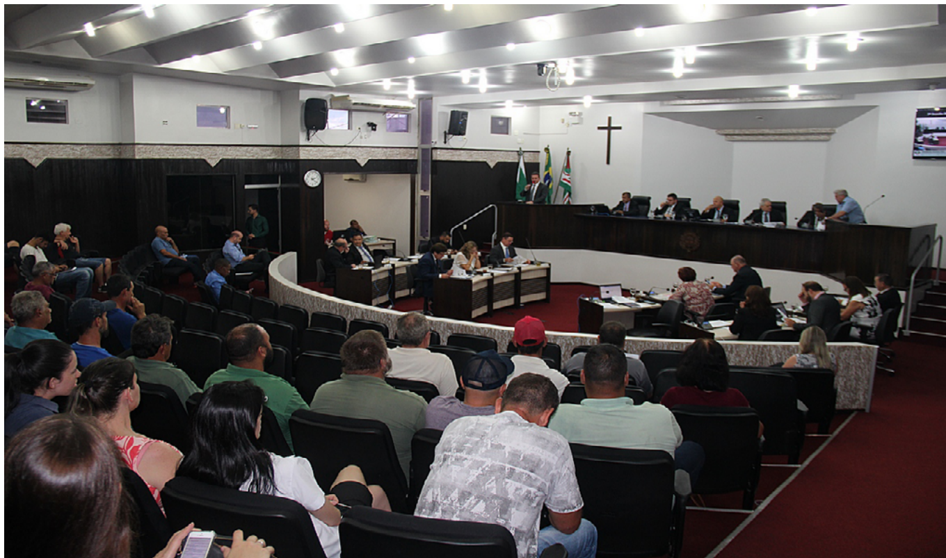
A sessão de segunda-feira aprovou uma série de projetos e rejeitou a participação de Toledo em consórcio de lixo

A Câmara de Toledo aprovou em sessão ordinária na segunda-feira, dia 16, o reajuste de 4,3% aos servidores, previsto no Projeto de Lei nº 18, votado por unanimidade em turno final. A sessão também votou o Projeto de Lei nº 133, que “autoriza e ratifica a participação do Município de Toledo no Consórcio Intermunicipal para a Gestão e Tratamento de Resíduos Urbanos do Oeste do Paraná”, o qual foi rejeitado por 10x9. Já o PL-Projeto de Lei nº 146, que institui o Código Municipal de Proteção aos Animais, teve apresentado um substitutivo pelos vereadores e assim retorna à Comissão Especial. Foram votados ainda o PL 175, que altera o Plano de Cargos e Vencimentos para os servidores públicos municipais; o PL 177, que altera o Plano de Cargos e Vencimentos para os servidores municipais; o PL nº 13, que altera o regime próprio de previdência dos servidores do Município de Toledo; o PL 15, que altera o Plano de Cargos e Vencimentos para os servidores municipais; o Projeto de Lei nº 17, que autoriza a abertura de créditos adicionais suplementar e especial de R$ 5,4 milhões no orçamento municipal, todos do Poder Executivo e aprovados por unanimidade. Os vereadores aprovaram ainda o PL 8, da vereadora Marli do Esporte, que declara de utilidade pública a Associação Benfícenete Cultural de Apoio às pessoas com Câncer e Pós Câncer (Amigas do Bem Viver). Entenda