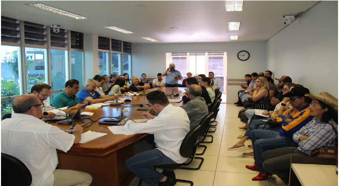
Reunião na Câmara na manhã de segunda-feira apresentou várias sugestões ao projeto em apreciação

https://www.toledo.pr.leg.br/assessoria-de-imprensa/noticias/reuniao-aberta-reavalia-projeto-do-codigo-de-protecao-dos-animais